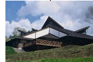
森のカルチャーセンター (県民の森内)